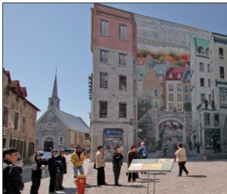
Fresque des Québécois

► Continuez sur Notre-Dame et tournez à gauche, sur la rue du Porche, où se trouve le parc de l'UNESCO , qui offre aux enfants des jeux à caractère historique et maritime. Tournez à droite sur la rue Saint-Pierre. La maison Stuart, située au 26, fut érigée en 1764.