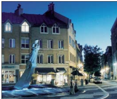
Place de la FAO

Un musée traitant de l'histoire navale de Québec est situé à l'extrémité nord de la rue Dalhousie. Pour vous y rendre, vous devez quitter le parcours, continuer tout droit sur la rue Saint-Paul et tourner à gauche sur la rue Dalhousie.