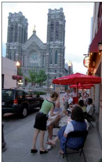
Rue Saint-Joseph et église Saint-Roch